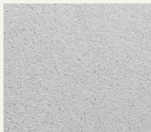
ARCHI+ TADELAKT 009