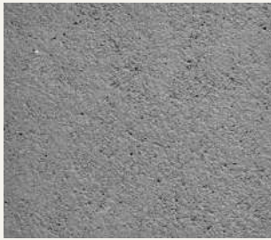
ARCHI+ TADELAKT 002