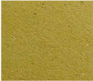
ARCHI+ TADELAKT 003